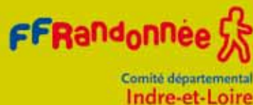
Impression Graphique, réalisation vignettes.com - édition juillet 2006, tirage de 5000 ex, CCM Paris 2004 - autorisations n° 42-2006-013