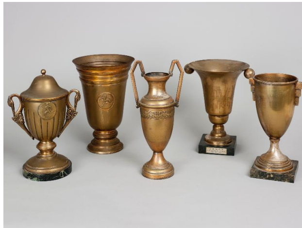
Trophées sportifs en forme de coupes (milieu du 20e siècle).