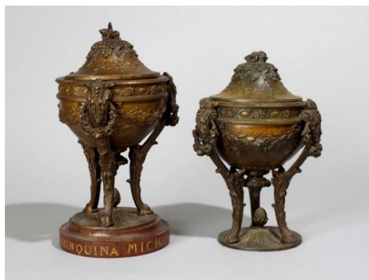
Ensemble de deux objets publicitaires servant de garnitures de cheminée (cassolettes à pot-pourri).

Le fonds se compose presque exclusivement de trophées sportifs (53 trophées), d'une lampe Art déco datant des années 1930-1940 fabriquée par Lumivase et de deux objets publicitaires servant de garnitures de cheminée (cassolettes à pot-pourri) créés pour la marque Quinquina Michaud à la fin du 19 e siècle ou au début du 20 e siècle.