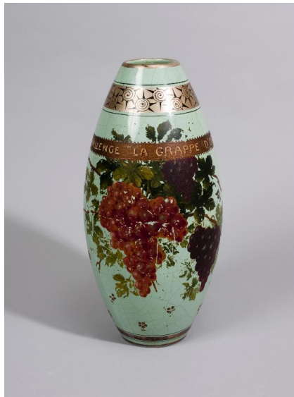
Vase Art déco fabriqué par Pinon-Heuzé et peint par Verdier.

- un trophée sous la forme d'un vase Art déco a été fabriqué par Pinon-Heuzé, à Tours, et peint par un nommé Verdier, dans les années 1920-1940.