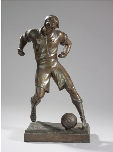
Footballeur par Lemoyne.