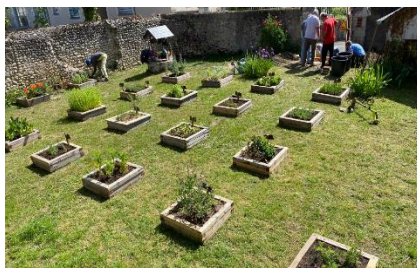
Création d'un jardin participatif à St-Martin-le-Beau - Les amis des parcs et jardins de Saint-Martin-le-Beau