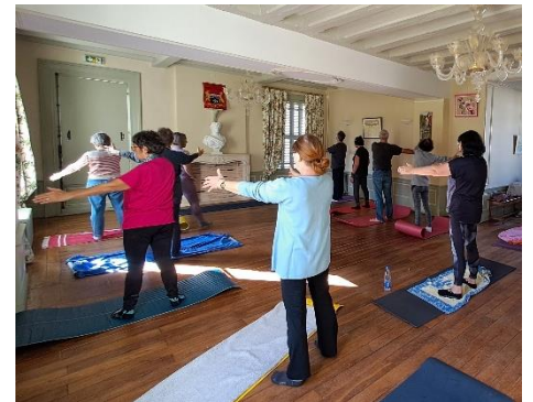
Pilates et patrimoine à La Croix-en-Touraine