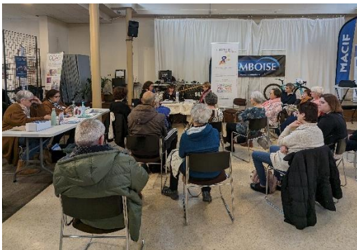
Journée sport santé bien-être à Amboise