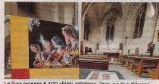
Le livre recense 4.400 objets religieux.