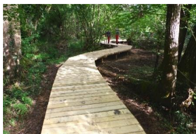
Protection de la forêt alluviale à Nouzilly