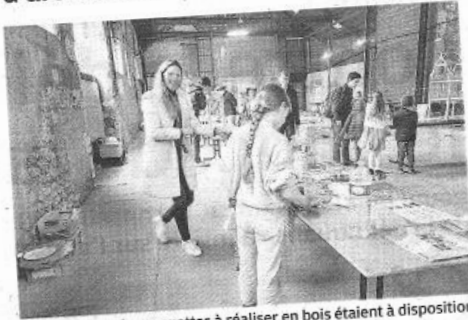
Toutes sortes de maquettes à réaliser en bois étaient à disposition du jeune public pour découvrir l'architecture.