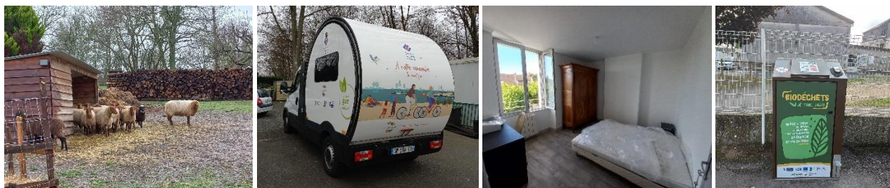
Exemples de projets soutenus sur le programme Leader 2014-2022

Au cours de cette année, l'équipe Leader a également été amenée à finaliser les derniers dossiers de demande de paiement du programme Leader 2014-2022. Cela représente 14 dossiers de demande de paiement montés avec les porteurs de projets en lien avec le service instructeur de la Région. 17 visites sur place ont été effectuées avant la mise en paiement des dossiers d'investissement et 20 projets ont reçu le versement de leur subvention LEADER en 2024. Les fiches bilan des projets sont en ligne sur le site internet du Pays.