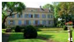
38. Château du Mortier ; 39. Moulin de la Vasrole ; 40. Logis de Châtres ; 41. Château de Pintray