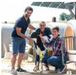
45. Une histoire de famille ! ; 46. Art et confitures ; 47. L'Homme des bois, peintre en lettres