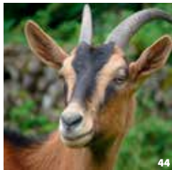
42. Chantier campanaire ; 43. Lustre ; 44. Chèvre de la Ferme des Petits Champs