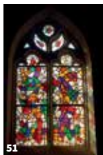
48. Maison Bellevue à Neuillé-le-Lierre © Blérot Photo ; 49. Manoir Thomas Bohier à Saint-Martin-le-Beau © PAH LT ; 50. Le Belvédère à Bléré © D. Guillemot ; 51. Vitreaux de l'église de Monnaie © PAH LT