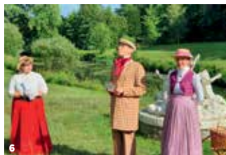
4. Parc du château de Pocé-sur-Cisse ; 5. Fougère magique ; 6. La Balade du Ventre