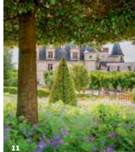
10. Parc Leonardo da Vinci 11. Château royal d'Amboise