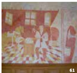
59. Église et château de Véretz ; 60. Décor Art Déco d'une maison d'Auzouer-en-Touraine ; 61. Peintures murales de l'église de Saint-Nicolas-des-Motets