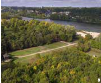
7. Tableau végétal © PAH LT ; 8. Île de la Métairie © Espaces Naturels Sensibles Touraine ; 9. Parc du château du Coteau à Azay © PAH LT