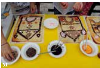
29. Bourg de Véretz ; 30. Musée d'art et d'histoire ; 31. Atelier gâteau façade