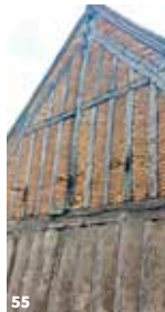
52. Château de la Vallière à Négron ; 53. Visite de Larçay ; 54. Église de Céré-la-Ronde ; 55. Pan de bois au Boulay