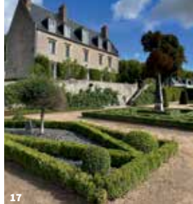
15. Château de la Bourdaisière ; 16. Une visite guidée ; 17. Le Grand Coteau