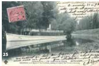
24. Navette fluviale par Moments de Loire © ADT Touraine; 25. Carte postale du « Sylvia », bateau à vapeur à Vouvray © PAH LT