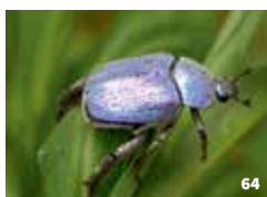
62. Musée d'art et d'histoire d'Amboise / 63. Musée du Cuir et de la Tannerie / 64. Hoplie