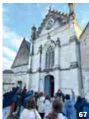
65. Atelier « Mon village dans ma classe » avec des maternelles ; 66. Atelier « Bâtisseurs du Moyen-Âge » avec des primaires ; 67. Visite de l'église de Montlouis-sur-Loire