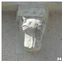
32. Atelier vitrail © PAH LT ; 33. Découverte du pont de Montlouis © OT Montlouis-Vouvray ; 34. Modillon de l'église de Mosnes © PAH LT