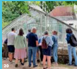
18. Voyage en 1963 au château de Fontenay ; 19. Bacchus dans le domaine de Fontenay ; 20. Cluedo patrimoine