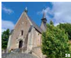
56. Fonte dans le parc du château de Pocé-sur-Cisse ; 57. Porte de l'Horloge à Château-Renault ; 58. Église de Francueil