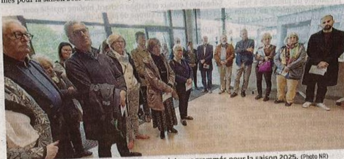
Les invités étaient très attentifs aux divers projets programmés pour la saison 2025.

Laurianne Keil fait remarquer que ce projet est en lien avec le renouvellement et les 40 ans du label « Villes et Pays d'art et d'histoire ». En plus de ces nouvelles propositions, la soirée a mis l'accent sur la cérémonie de nomination des premiers ambassadeurs et ambassadrices.